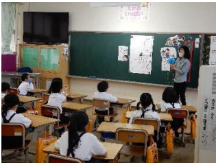
【1組：「道徳」で思いやりの心を学んでいます】

22日(水)に予定していた授業参観。今年度に入って延期が続き、ぜひこの機会に子どもたちの姿を見ていただきたいと考えていたのですが…、まん延防止等重点措置の延長により、中止せざるを得ないことになりました。せめて、少しでも子どもたちの授業の様子をお知りいただきたいと考え、今号からしばらくの間、授業風景を学年ごとに紹介したいと思います。まずは、1年生の様子をどうぞ。