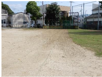
【100mのコースがくっきりと浮かび上がりました】