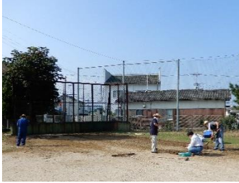
【残暑の中、早朝からの作業、ありがとうございます】